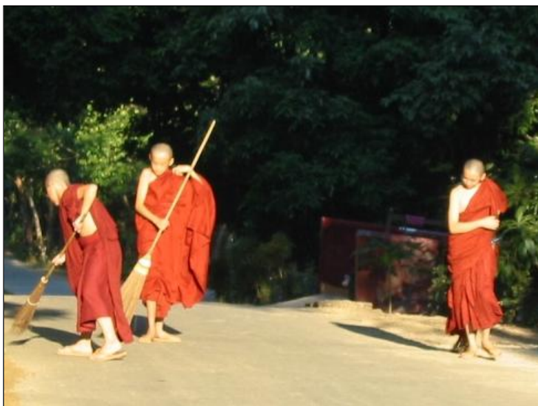
▲ 弟子有服务师长的义务