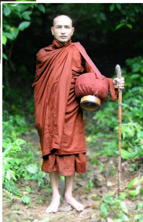
上图：偏袒右肩披着上衣