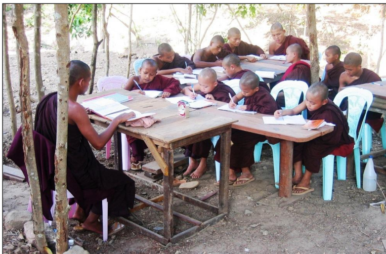
▲ 师长有教导弟子的义务