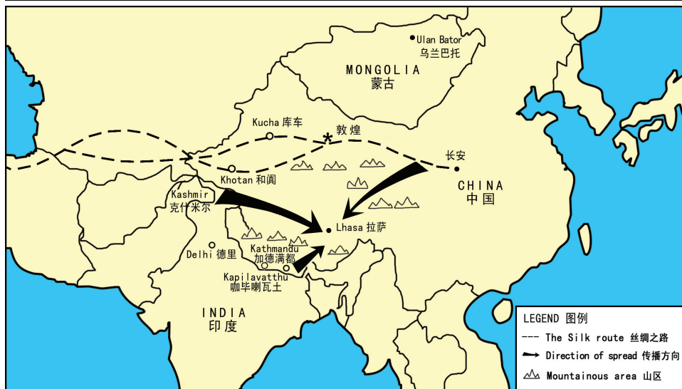
佛教传到藏地 (佛纪1100-1600年, 公元7-11世纪)