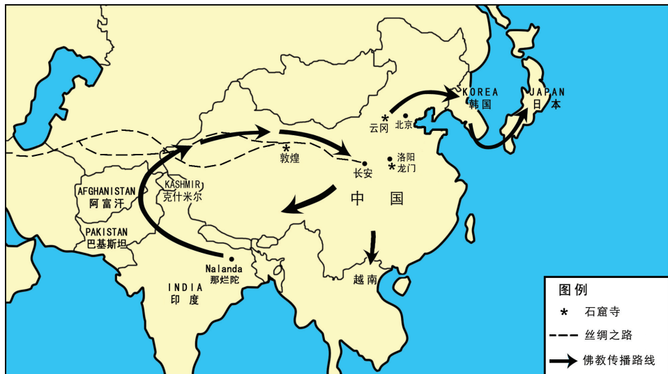
佛教往北传到中、韩、日等地 (佛纪500-1500年, 公元前1-10世纪)