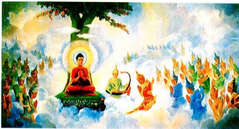
The Buddha preaching the Abhidhamma (Higher Doctrine) to His former mother, now a Deva and others in Tavatimsa Heaven.