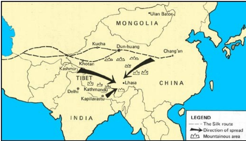
佛教傳到藏地（佛紀 1100-1600 年，西元 7-11 世紀）

佛教傳入藏地的時間是在佛滅 1100 年到 1600 年之間，那個時候印度本土的佛教已經發展成「大乘密教」。所以藏傳佛教帶有濃厚的密教色彩，崇尚唸咒、火供等等，這些都反映了印度佛教發展到末期階段的情形。當時的佛教越過喜馬拉雅山傳到了西藏，故稱為「藏傳佛教」。藏傳佛教接受的是從佛滅 1100 年到 1600 年這段時期的佛法，所以藏傳佛教與漢傳佛教有很大的區別，和南傳佛教則有更大的不同。